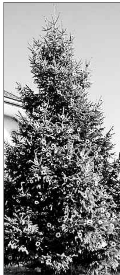
Man darf gespannt sein, wie sich die Pracht gepaart mit Schnee präsentieren wird.

Gampelen / 800 Sonnenblumen aus Stoff statt Kerzen und Kugeln: Die aussergewöhnliche Dekoration der stolzen Tanne auf dem Gelände der Stiftung Tannenhof überrascht. Und sie symbolisiert Wärme, Kreativität und Offenheit.